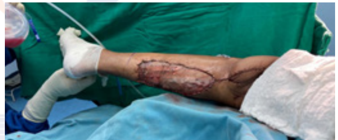
Figura 8. Colocación de injertos de piel en la zona donadora del colgajo a nivel de cara posterior de la pierna izquierda.

La cobertura de la zona donadora de tejidos a nivel de la pierna se realiza con injertos de piel tomados de la cara posterior del mismo muslo, los cuales previo mallado se colocan en dicha área y, se fijan mediante suturas continuas con material no reabsorbible (2) . (Figura 8).