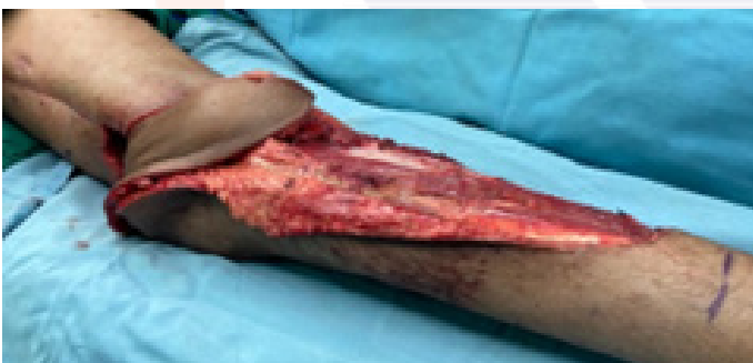
Figura 6. Colgajo rotado a defecto en el muslo.

La piel intermedia entre el defecto y el punto de rotación se incide y el colgajo se moviliza hacia el defecto en el muslo (Figura 6) (2) .