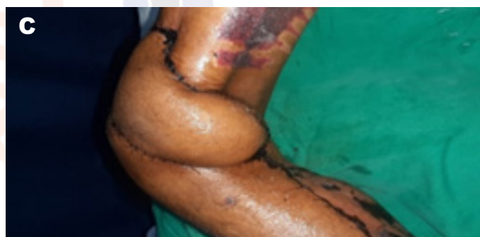
Figura 12. A, B, C. Control al mes posoperatorio.