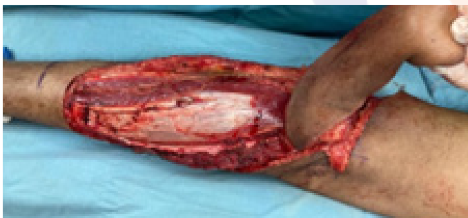
Figura 5. Rotación de colgajo a nivel de su punto de pivote hacia defecto en el muslo.

Seguidamente se procede a elevar el colgajo de distal a proximal, identificando y seccionando tanto el nervio motor que inerva el músculo gastrocnemio y el origen del mismo a nivel del cóndilo femoral medial. El punto de pivote se localiza en el pliegue poplíteo o justo debajo de él, donde el pedículo del gastrocnemio entra en el músculo (Figura 5) (2,11) .