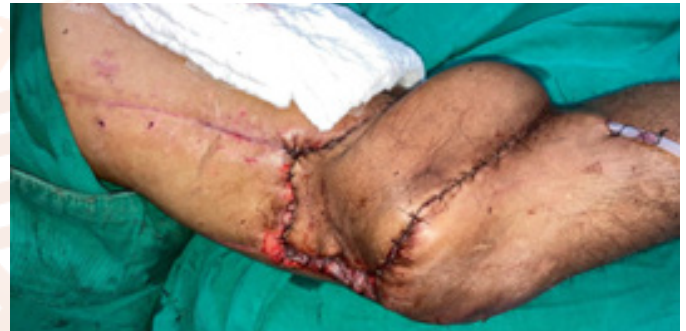
Figura 7. Fijación de colgajo hacia herida en muslo mediante suturas.

Posteriormente se fija el colgajo a la zona receptora con poliglactina 3/0 a nivel de músculo y tejido celular subcutáneo, mientras que la piel se sutura con monofilamento no reabsorbible 4/0 (Figura 7).