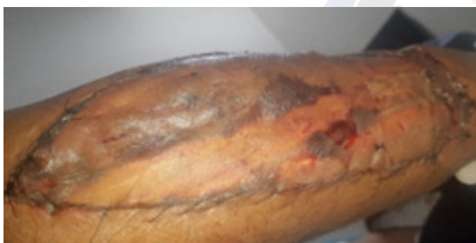
Figura 11. Integración de injertos a nivel de la zona donadora del colgajo.

Al quinto día se realiza la revisión de los injertos evidenciándose un 99% integrados (Figura 11).