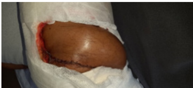
Figura 10. Vitalidad del colgajo a las 12 horas posquirúrgicas.

A las doce horas posquirúrgicas el colgajo permanece 100% vital manteniéndose así hasta el momento del alta (Figura 10).