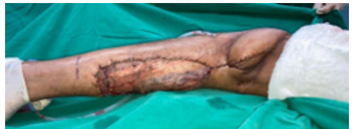
Figura 9. Final del procedimiento quirúrgico evidenciándose el colgajo vital.

Al finalizar el procedimiento se evidencia el colgajo 100% vital, con llenado capilar de dos segundos (Figura 9). El injerto de piel se cubre con gasa vaselinada, compresas y venda de gasa. Para valorar la vitalidad de la pastilla de piel se confecciona una ventana en el vendaje.