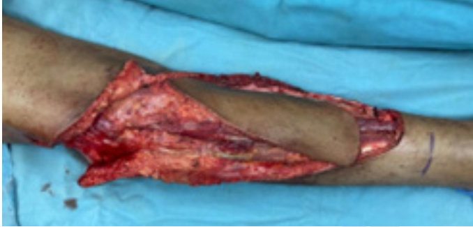
Figura 4. Incisión y levantamiento de colgajo sobre sitios de marcación previa.

plano entre el músculo gastrocnemio y el soleo, posteriormente con disección digital se levanta el vientre del gemelo medial. Luego una segunda incisión se realiza en el borde lateral del gastrocnemio medial y la cosecha del colgajo se completa al realizar la incisión distal a nivel del tendón de Aquiles teniendo cuidado de no lesionar su paratendón (Figura 4) (2,11) .