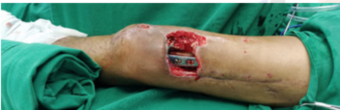
Figura 2. Perdida de sustancia de espesor total a nivel de la cara anterolateral, tercio distal del muslo izquierdo de aproximadamente 10 cm x 8 cm.

Además, se observa dehiscencia de anclajes del tendón rotuliano, el cual también presenta una pérdida de sustancia de aproximadamente 2x3 cm. (Figura 2).