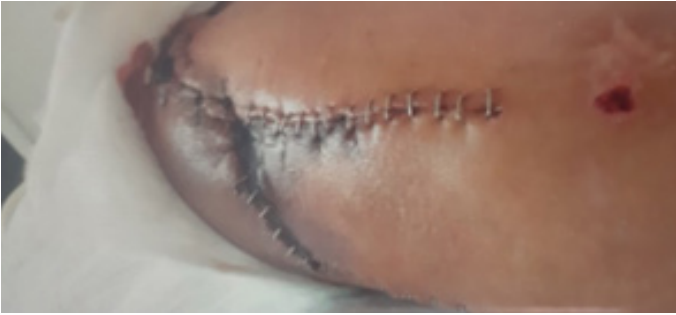
Figura 1. Sufrimiento de bordes de colgajos para colocación de placa en fémur distal.

Además, se observa dehiscencia de anclajes del tendón rotuliano, el cual también presenta una pérdida de sustancia de aproximadamente 2x3 cm. (Figura 2).